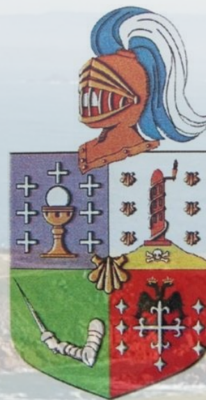
Orden de Caballeros de María Pita