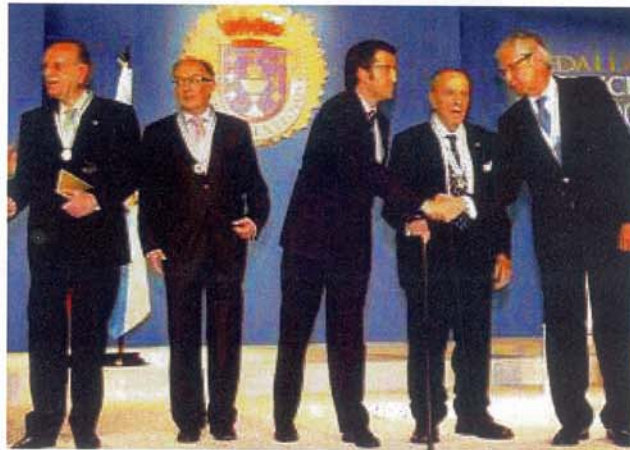
Los Caballeros de Honor 2003 y 2005, Medalla de Oro de Galicia 2009

Muy Noble y Muy Leal Orden de Caballeros de María Pita N° 27 – septiembre – 2009