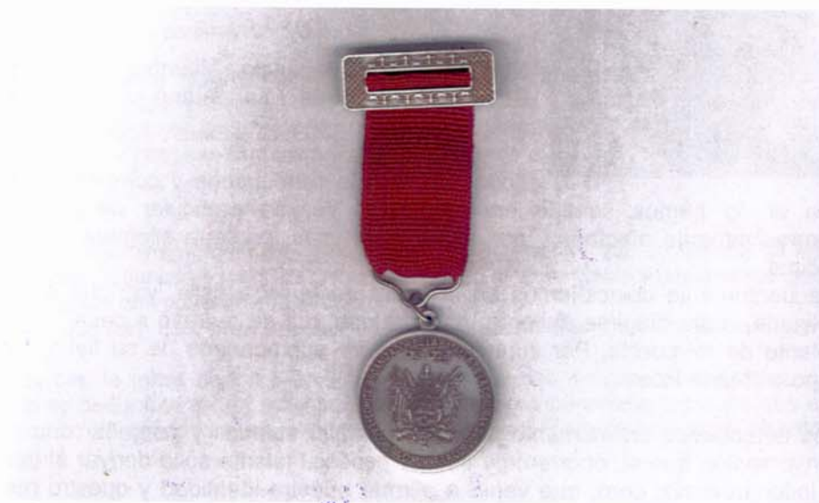
Medalla de Plata del Bicentenario de la Batalla de La Coruña. Concedida por el Comité Organizador a la Orden de Caballeros de María Pita

Muy Noble y Muy Leal Orden de Caballeros de María Pita N° 23 – septiembre – 2008